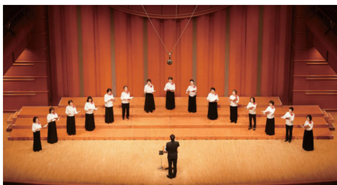
合唱 クール・マチュール Chœur Mature