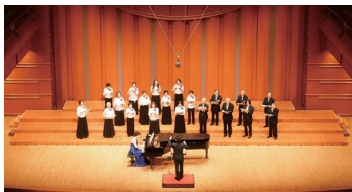
合唱 混声「調」 KONSEI “Shirabe”